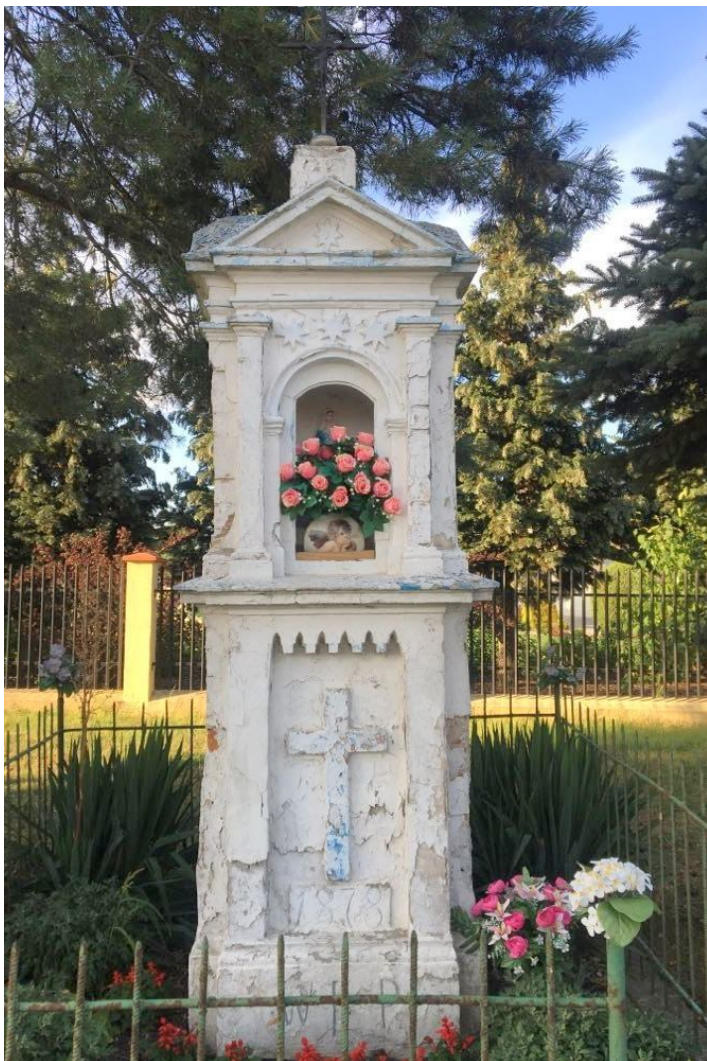
Widok od południowo-zachodu

7. Fotografia z opisem wskazującym orientację w stosunku do sąsiednich terenów lub stron świata albo mapa z zaznaczonym stanowiskiem archeologicznym