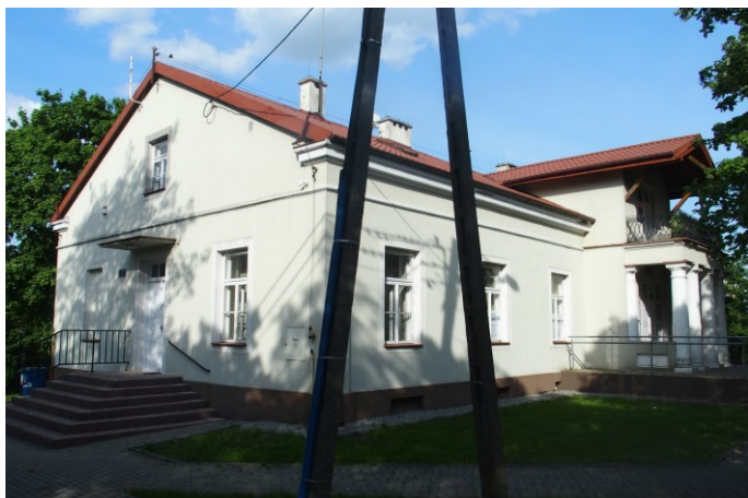
Widok budynku od południowo-zachodu

Nowe Proboszczewice ul. Floriańska 7 nr działki ew. 77/8, obręb Proboszczewice Nowe 09-412 Nowe Proboszczewice