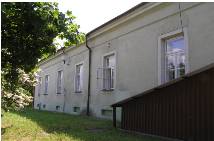
Widok budynku od północno-wschodniego