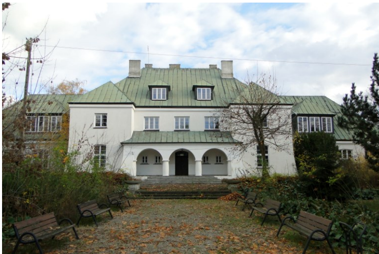
Widok od północnego-zachodu

7. Fotografia z opisem wskazującym orientację w stosunku do sąsiednich terenów lub stron świata albo mapa z zaznaczonym stanowiskiem archeologicznym