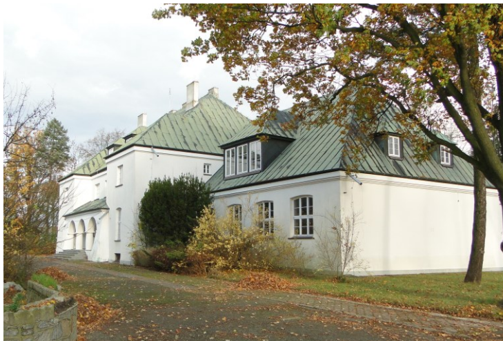
Widok od południowego-zachodu