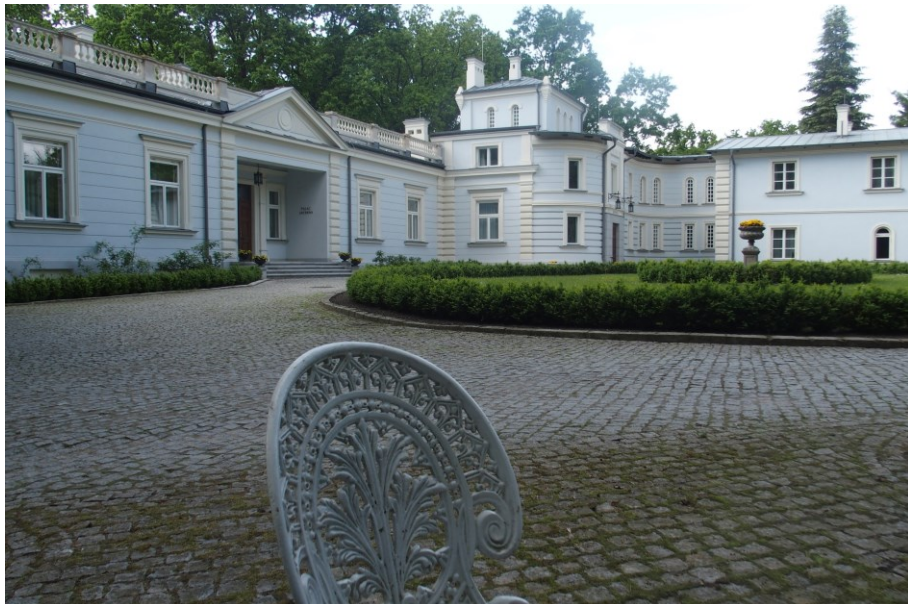
Widok budynku od południowego-wschodu

7. Fotografia z opisem wskazującym orientację w stosunku do sąsiednich terenów lub stron świata albo mapa z zaznaczonym stanowiskiem archeologicznym