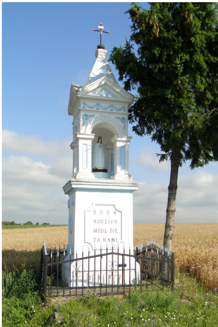
Widok od południa

7. Fotografia z opisem wskazującym orientację w stosunku do sąsiednich terenów lub stron świata albo mapa z zaznaczonym stanowiskiem archeologicznym