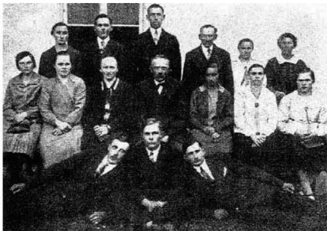
Sanoerchor zu Maszewo

Pierwsi osadnicy mieszkali w ziemiankach. Dopiero po pewnym czasie rozpoczęto budowę domów, które tworzone były w konstrukcji szkieletowej, z drewna, fugi klejone z błota i słomy oraz dachu słomianego. Władze niemieckie przekazywały również osadnikom narzędzia rolne oraz pieniądze na karczowanie. Wielu kolonistów po przybyciu na miejsce miało inne spojrzenie na temat nowego domu, niż te które zostało opisane przez rekruterów w Niemczech. Konstrukcje niemieckich domów były wykorzystywane w cieplejszym klimacie. Nowi mieszkańcy narzekali na okrutne zimno podczas zimy.