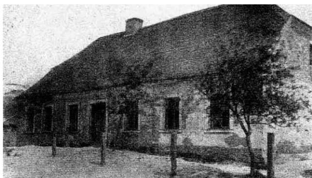
Schule zu Maszewo