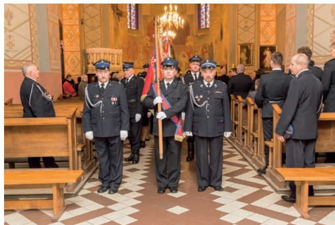
więcej zdjęć - strona 19.

Wszystkim druhom i druhom z OSP Wyszyna z okazji ich święta składamy jak najlepsze życzenia wszystkiego najlepszego zarówno w życiu prywatnym, a także w pięknej, ale trudnej służbie dla swoich mieszkańców.