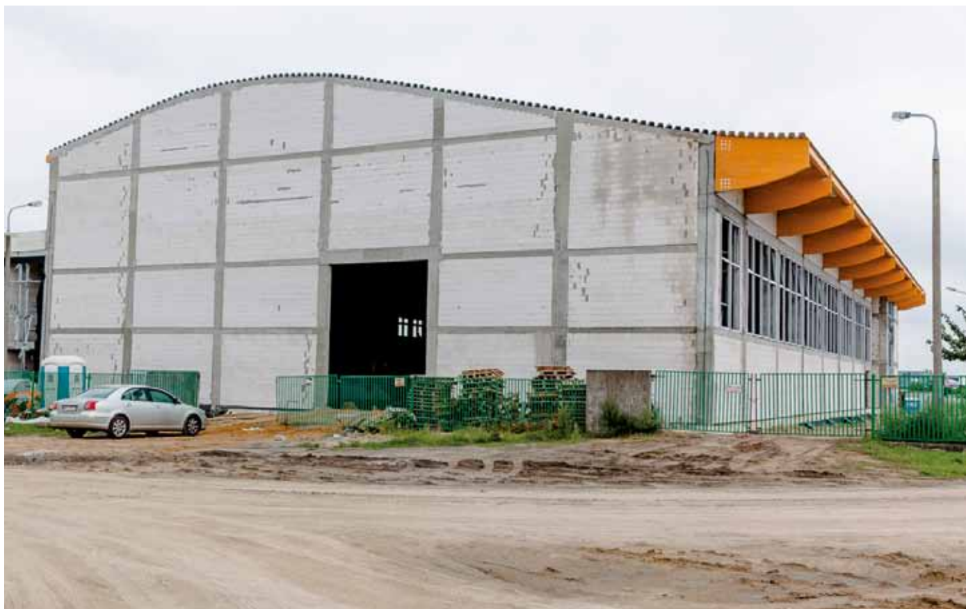
Budowa Hali Sportowej przy szkole w Maszewie Dużym.

W Zespole Szkolno-Przedszkolnym w Wyszynie naukę w szkole rozpoczęło 15 uczniów. Natomiast w VII klasie jest ich 14. W sumie w całej szkole uczy się 128 dzieci. Natomiast przedszkolaków jest 148. Z kolei w Przedszkolu Samorządowym w Nowych Proboszczewicach zajęcia rozpoczęło 136 dzieci.