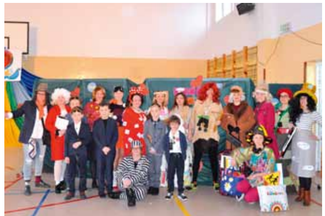
W szkole w Starych Proboszczewicach uczniowie bawią się razem z nauczycielami i dyrektką.

W szkole zebrano 10 862,02 zł i 8,21 euro, a wolontariusze zebrali 2624,18 zł.