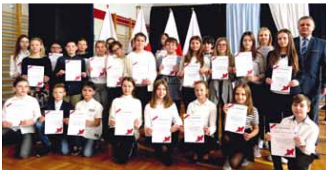
Stypendyści w Maszewie Dużym - klasy 5-6