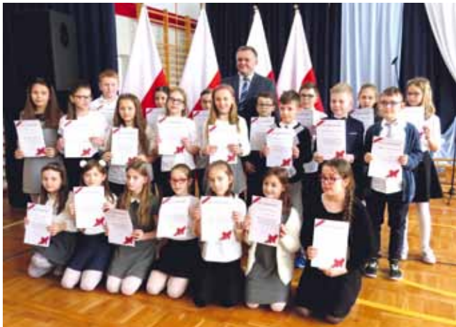
Stypendyści w Maszewie Dużym - klasa 4

W Szkole Podstawowej im. Władysława Stanisława Reymonta w Maszewie Dużym po I półroczu w szkole podstawowej i klasach trzecich gimnazjum przyznano łącznie 81 stypendiów naukowych.