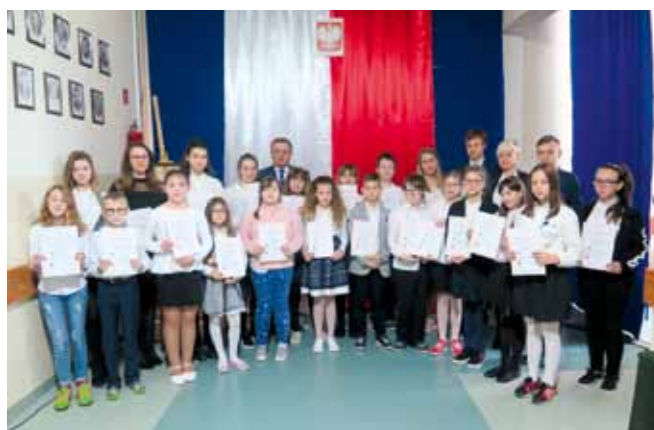
Stypendiści ze szkoły podstawowej w Wyszynie