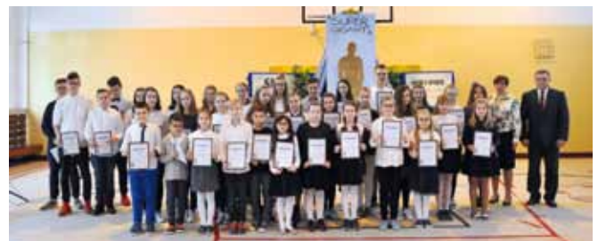
Stypendyści Stare Proboszczewice - nauka

W Szkole Podstawowej w Starych Proboszczewicach stypendia za wyniki w nauce otrzymali: