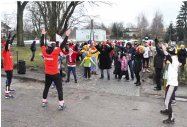
Rodzinny bieg przebierańców - odbył się po raz pierwszy.