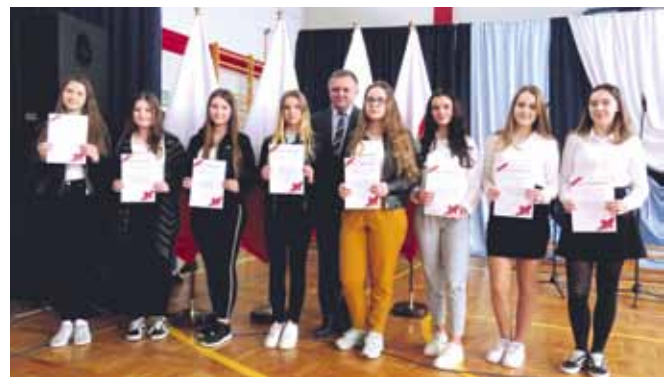
Stypendyści w Maszewie Dużym - klasa 3 gimnazjum