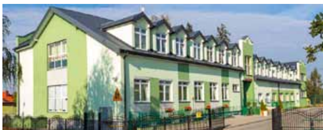
Zespół szkolno-przedszkolny w Wyszynie. W bieżącym roku powstanie dokumentacja dotycząca rozbudowy tego budynku.

Dział Obsługa długu publicznego dotyczy wydatków w wysokości 325 000 zł, które musimy ponieść w roku budżetowym na spłatę odsetek od naszego zadłużenia. Natomiast dział Różne rozliczenia dotyczy utworzenia obowiązkowej rezerwy ogólnej oraz rezerwy celowej w wysokości 370 000 zł z przeznaczeniem na zarządzanie kryzysowe.