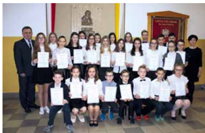
Stypendiści w szkole podstawowej w Starej Białej