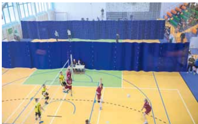
Hala w Maszewie Dużym oferuje możliwość korzystania z obiektu kilku grupom jednocześnie.

Obecnie już w pełni można korzystać z części sportowej. I trzeba sobie to jasno powiedzieć - jest z czego korzystać. Główna płyta boiska (20 x 40 m) jest przystosowana do rozgrywania praktycznie każdej z halowych dyscyplin sportu, od piłki ręcznej do badmintona. Dobrym rozwiązaniem jest możliwość podzielenia płyty boiska na trzy części. Dzięki temu można np. rozgrywać jednocześnie dwa mecze siatkówki, a i tak jest jeszcze wolny teren na przeprowadzenie rozgrzewki. Można też podzielić salę w stosunku 2/3 do 1/3 co sprawia, że np. na jednej części odbywają się zajęcia fitness, a na drugiej rozgrywany jest mecz siatkówki czy badmintona.