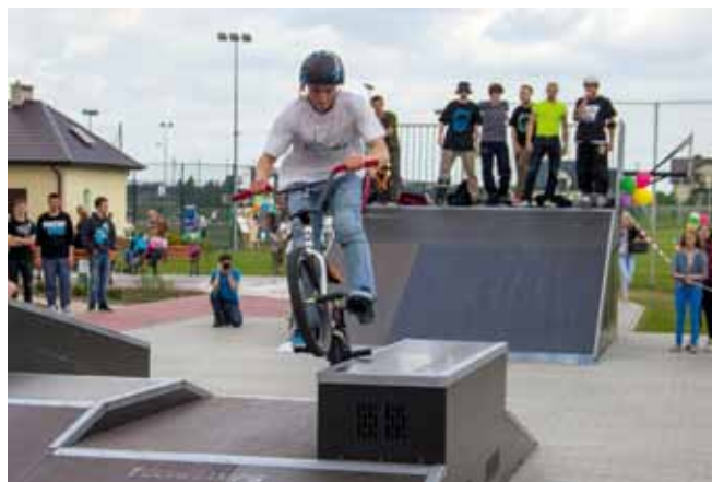
Na terenie szkoły znajduje się profesjonalny skate-park.