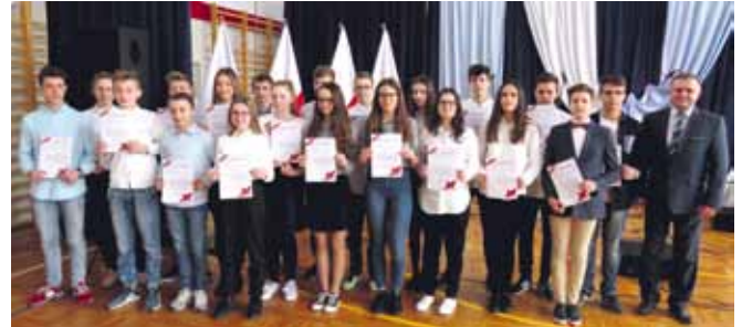
Stypendyści w Maszewie Dużym - klasy 7-8