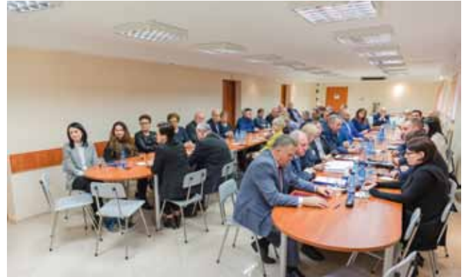
Obrady Rady Gminy są otwarte dla wszystkich zainteresowanych.

Na V sesji Rady Gminy Stara Biała, która odbyła się 28 marca, podjęto następujące uchwały: