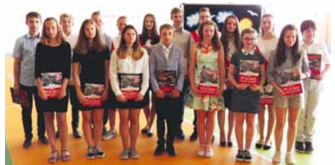
Maszewo Duże - Stypendyści kl. 7