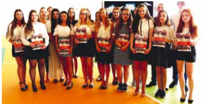
Maszewo Duże - stypendyści kl. III gimnazjum