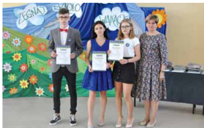
Stare Proboszczewice stypendyści sportowi w gimnazjum