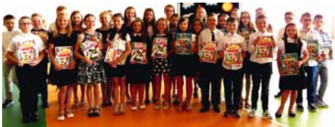
Maszewo Duże - Stypendyści kl. 4