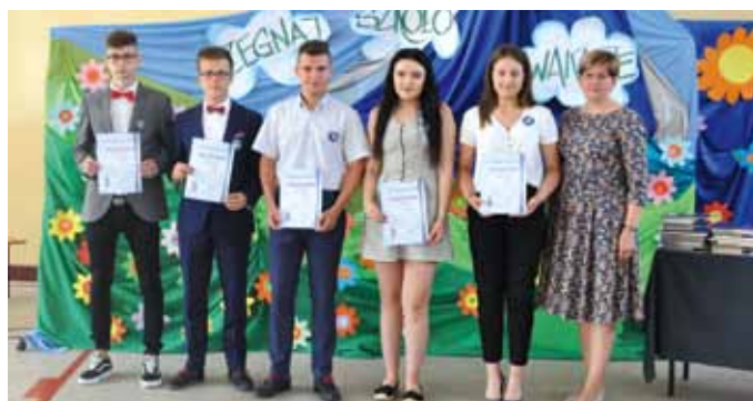
Stare Proboszczewice stypendyści naukowci w gimnazjum