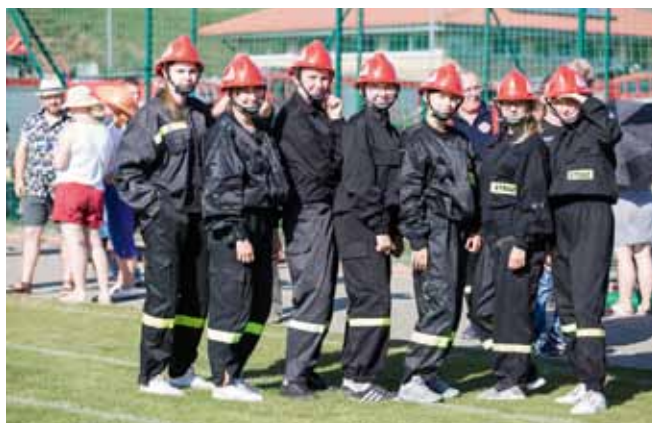
„Piękniejsza strona” OSP