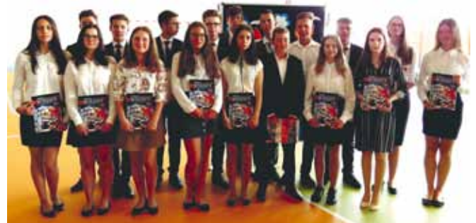
Maszewo Duże - Stypendyści kl. 8