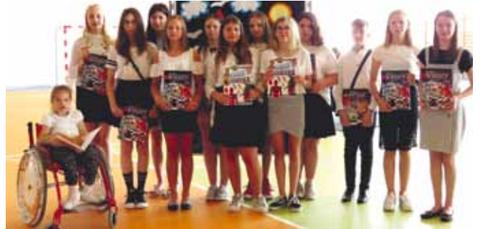
Maszewo Duże - Stypendyści kl. 6