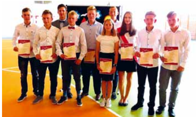
Maszewo Duże - stypendyści sportowi