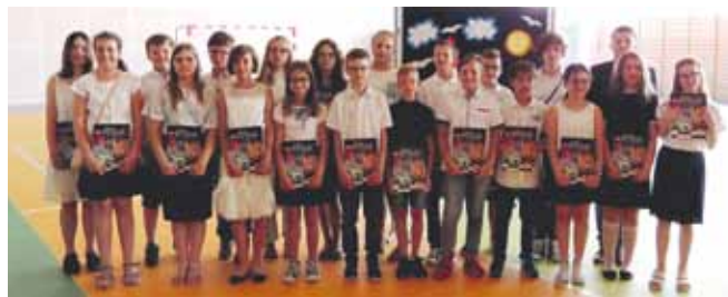
Maszewo Duże - Stypendyści kl. 5