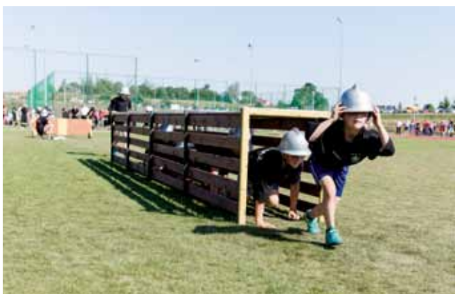
Tor przeszkód dla najmłodszych strażaków

W kategorii męskich drużyn pożarniczych swoje reprezentacje zgłosiły wszystkie jednostki OSP funkcjonujące na terenie gminy. Z kolei w kategorii drużyn kobiecych do rywalizacji przystąpiły panie z OSP Bronowo–Zalesie, OSP Dziarnowo i OSP Proboszczewice. Zawody rozgrywane były w konkurencjach: ćwiczenia bojowe oraz sztafeta pożarnicza 7x50 m z przeszkodami.