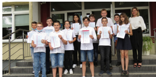
Stypendyści z kl. VI B z SP w Maszewie Dużym