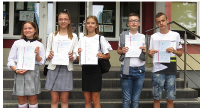
Stypendyści z kl. VI A z SP w Maszewie Dużym