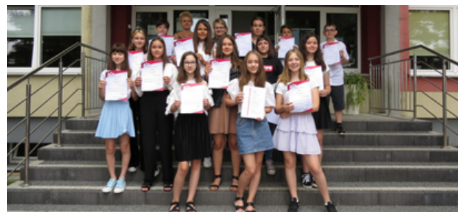
Stypendyści z kl. VI C z SP w Maszewie Dużym