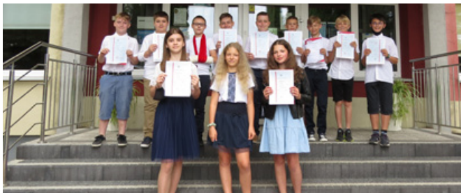
Stypendyści z kl. IV B z SP w Maszewie Dużym