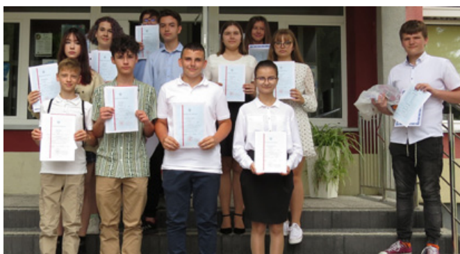
Stypendyści z kl. VII B z SP w Maszewie Dużym