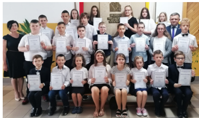
Stypendyści z SP w Starej Białej