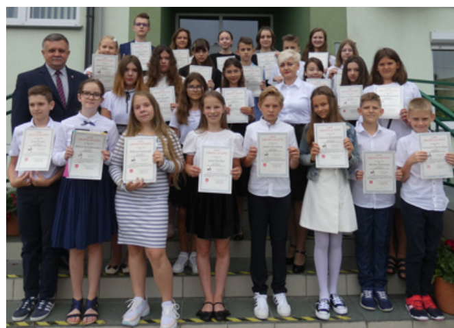
Stypendyści z SP w Wyszninie