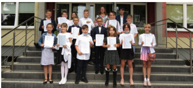
Stypendyści z kl. IV A z SP w Maszewie Dużym