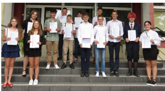
Stypendyści z kl. VII A i C z SP w Maszewie Dużym