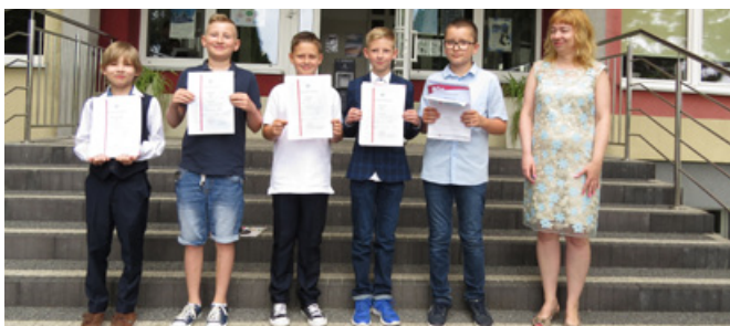
Stypendyści z kl. V A z SP w Maszewie Dużym